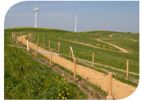
Energieopwekking op voormalige stortplaats Schoteroog bij Haarlem (Afvalzorg)

Stortplaatsen ontwikkelen zich tot energieparken, door het benutten van stortgas en het plaatsen van zonnecellen en windmolens. Tijdens de innovatiemiddag van de Vereniging Afvalbedrijven wisselden stortplaatsexploitanten innovatieve energie-ideeën uit.